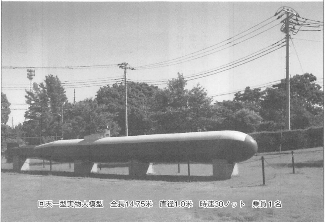
回天一型実物大模型 全長14.75米 直径1.0米 時速30ノット 乗員1名