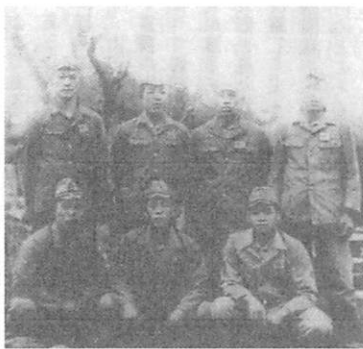
大村基地工作科宿舎前にて

「全飛行隊即時待機」で紫電改が一斉にエンジン始動、轟音が朝から鳴り響いていた。五番機を補修するよう命令が下る。直ちに工作補修班を編成、工具箱を担ぎ現場に急行した。